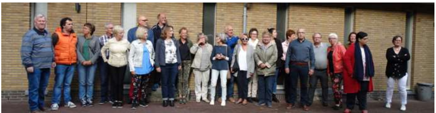
De vrijwilligers van het Princenhaags museum